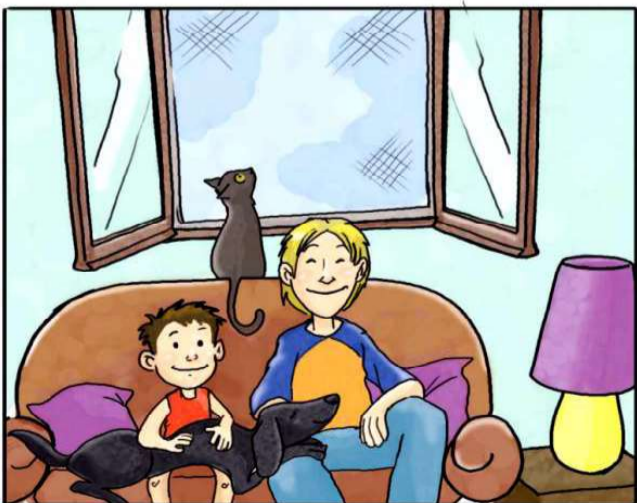
IN CASA USA LE ZANZARIERE ANZICHÉ ZAMPIRONI E FORNELLETTI.