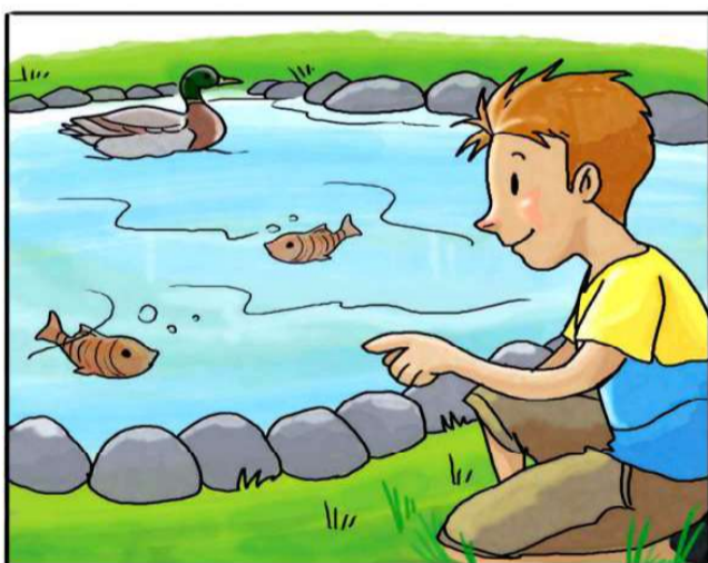
INTRODUCI I PESCI IN VASCHE E FONTANE.