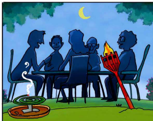
QUANDO SOGGIORNI ALL'APERTO, PROTEGGITI CON REPELLENTI AMBIENTALI. (*)

(*) Leggi attentamente le istruzioni riportate sulle confezioni.