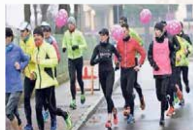
29 a "Marcia dee Mastee"