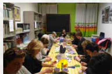
"Le Carabattole di Arianna"