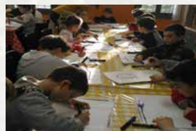
Sperimentando in Biblioteca: "Laboratorio di Robotica"