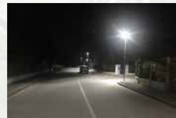
Alcuni dei nuovi punti luce