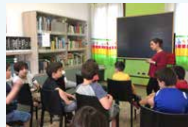
Laboratorio "Ti racconto la Scienza"

Inoltre, all'interno del giardino, sono state allestite alcune postazioni dove i nostri botanici in erba hanno potuto sperimentare altre tecnologie (ad un microscopio con telecamera wifi che attraverso un'apposita app inviava il segnale video agli smartphone, in questo modo ogni singolo partecipante ha potuto vedere e "fotografare" la propria cellula).