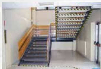
Vecchia scala interna