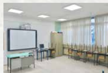
Nuove luci a LED installate