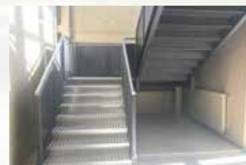
Nuova scala interna